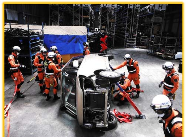
横転した事故車両の安定化