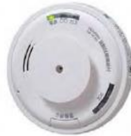
都市ガス用 (天井設置型)