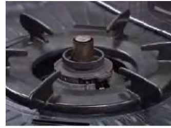
(天ぷら油過熱防止機能)