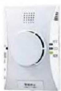
都市ガス用 (壁掛型)

ガス機器による火災や事故を総合的に防止するためには、ガス漏れと一酸化炭素の発生を検知するガス・CO警報器に、熱又は煙感知機能が加わった住宅用火災・ガス・CO警報器を設置することが有効です。