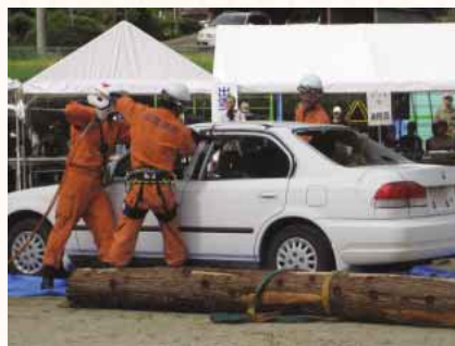
【平成19年 出雲市防災訓練より】

9月1日は防災の日です。この日は出雲市多伎町の岐久小学校及び多伎中学校において出雲市防災訓練が行われます。メイン会場では「各防災関係機関の連携による災害対応」をテーマに豪雨による水害・土砂災害や大規模地震災害を想定した訓練が行われます。みなさんもお出掛けの機会を高めましょう！